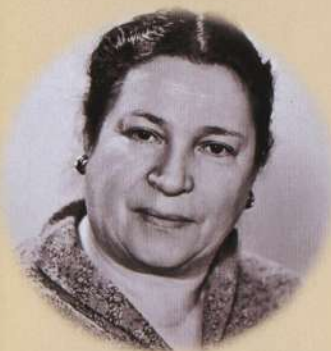
Агния Львовна Барто